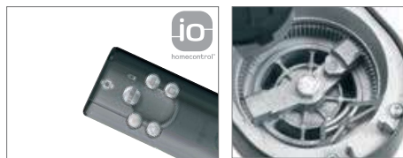
Obousměrný rádiový přenos