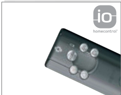
Obousměrný radiový přenos